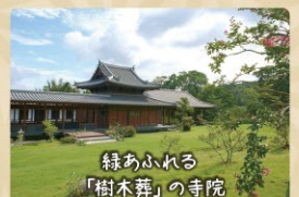
真光寺 しんこうじ

曹洞宗真光寺は、開山から460年の禅寺。自然葬のひとつである樹木葬の墓苑で注目を集めています。無農薬のお米づくりや森林整備なども手がけ、四季の花咲く開かれた寺院、「里山の禅センター」として様々な活動を展開しています。