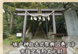
坂戸神社 さかどじんじや

県指定天然記念物「坂戸神社の森」の中にある坂戸神社は、袖ヶ浦で最も規模が大きい本殿を持つ神社です。市指定有形文化財である「坂戸神社古式祭典図巻」は、明治時代の坂戸神社のお祭りの様子が描かれていて、当時の風俗や信仰を知るうえで大変貴重な資料です。