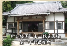
飯富寺 いいとみじ

新上総国三十三観音霊場の第二十七番札所に数えられ、お寺を訪ね歩く巡礼に熱心に取り組まれているお寺です。本尊の「十一面千手観音菩薩立像」は、市の指定有形文化財にも指定され、穏やかな表情で巡礼に訪れる人々を優しく見守っています。