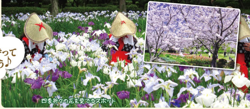
四季折々の花を愛でるスポット

☎0438-62-2707 ☑長浦1-1-111 ☑https://www.konayamaru.com