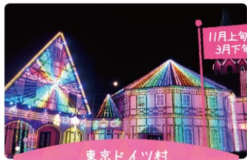
東京ドイツ村 ウィンターイルミネーション

音と光のショー、チャイナランタンや光のトンネルなど、イルミネーションが幻想的な世界に誘います。そのスケールは約300万球で関東最大級の規模を誇ります。