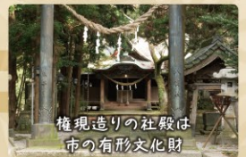
権現造りの社殿は市の有形文化財