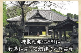
延命寺 えんめいじ

奈良時代神亀元年(724年)に行基によって創建されたといわれています。江戸時代には三代将軍家光から寄進を受けるなど、袖ヶ浦で最も栄えたお寺の一つでした。江戸時代に造られた百地蔵には、多くのお札が貼られており、今も多くの方が参拝に訪れています。