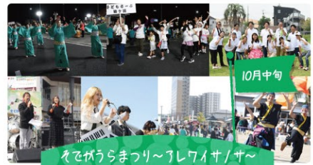
そでがうらまつり〜レワイサ/サ〜

【会場】鉾富神社(7月下旬) ☎飯富2863 C-4 【会場】率土神社(10月中旬) ☎神納3382 B-4 【問合せ】袖ヶ浦市生涯学習課 ☎0438-62-3744 (一社)袖ヶ浦市観光協会 ☎0438-62-3436